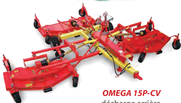
OMEGA 15P-CV décharge arrière